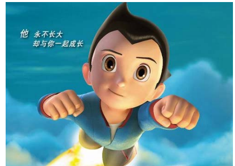
受《阿童木》票房不佳影响，意马股价大跌