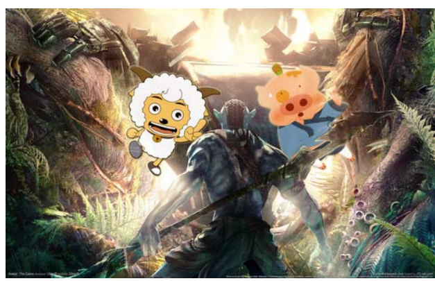
纵观近年国产动画电影市场，只有喜羊羊和麦兜票房成绩突出