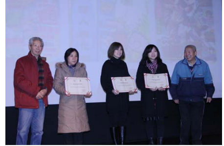
2009 年度中国漫画年会上颁发了多个奖项