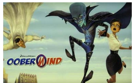
梦工场动画为《超级大坏蛋》举行发布会