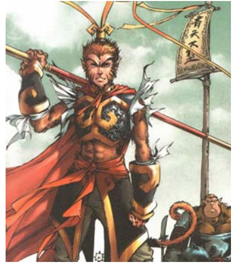
安徽美术出版社与神界联手打造《西游记》