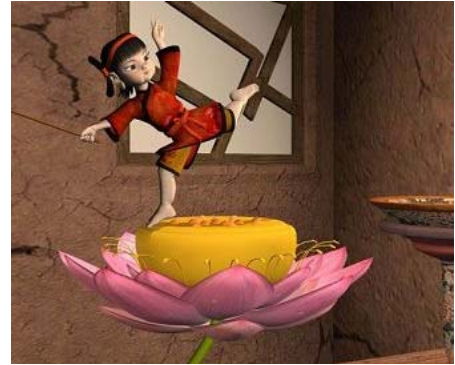
经典动画《渔童》将推出立体版